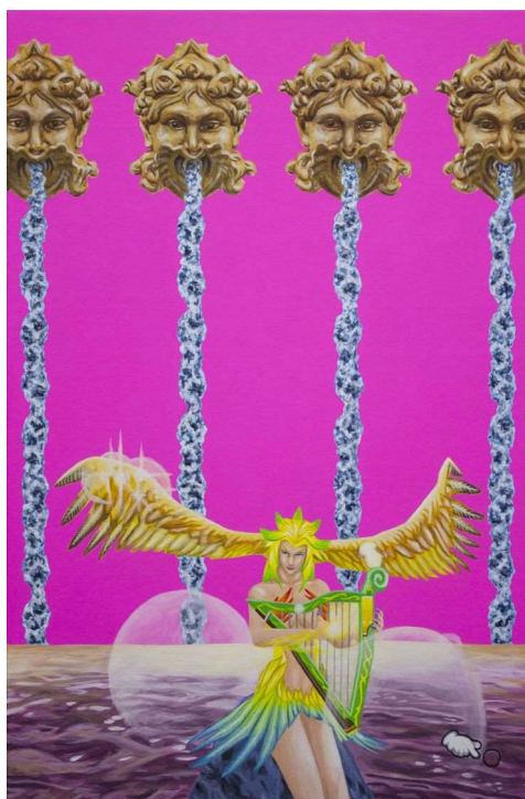
Illustration Yannick Lambelet

En outre, dans le cadre des réunions avec le jury qui décernera la titre de Capitale culturelle suisse, des rencontres ont eu lieu avec des représentant.e.s des milieux culturels au niveau national. A cette occasion, certains membres ont pu exprimer l'intérêt d'un tel projet non seulement pour La Chaux-de-Fonds mais aussi pour de nombreuses régions suisses.