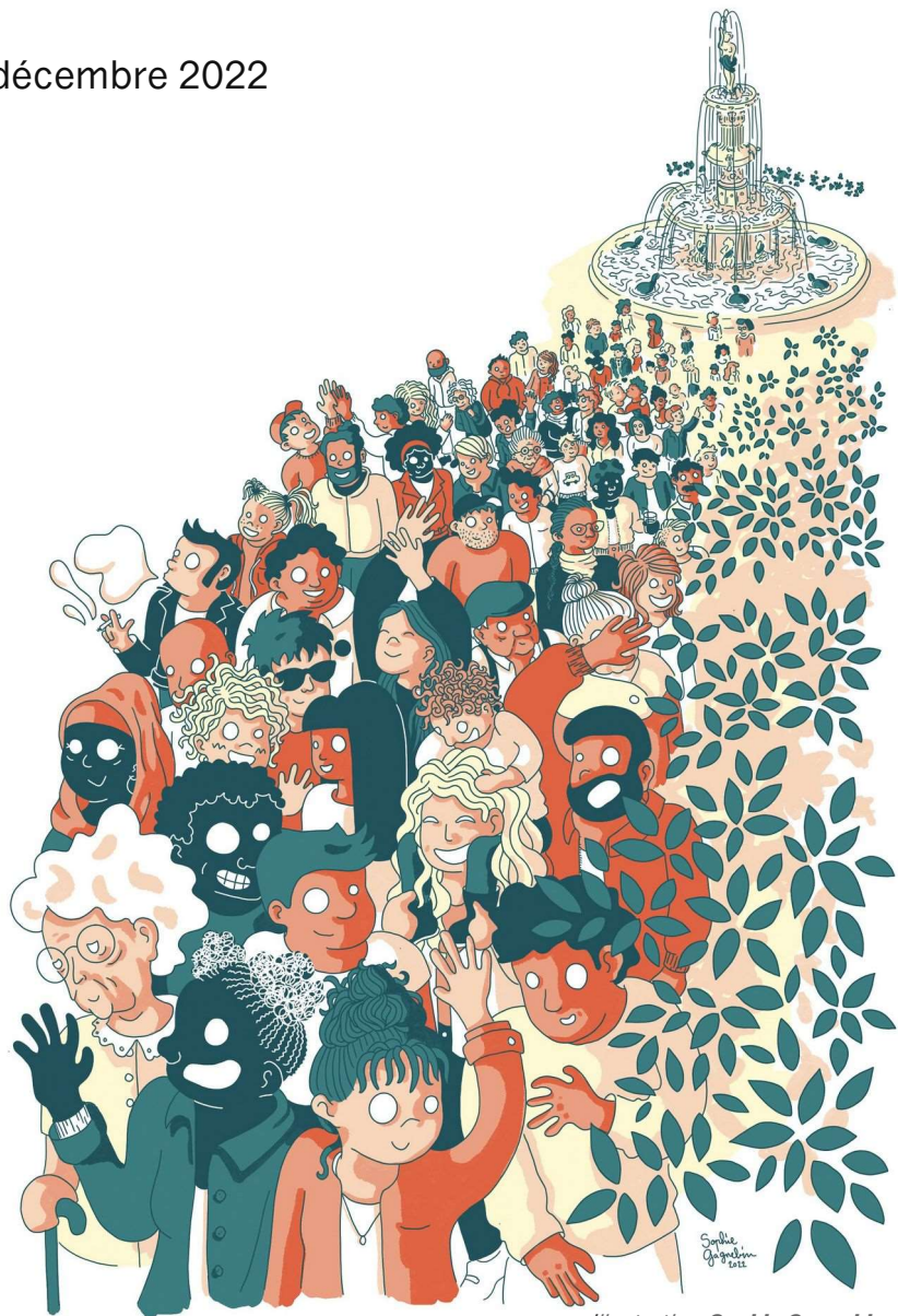
Illustration Sophie Gagnebin