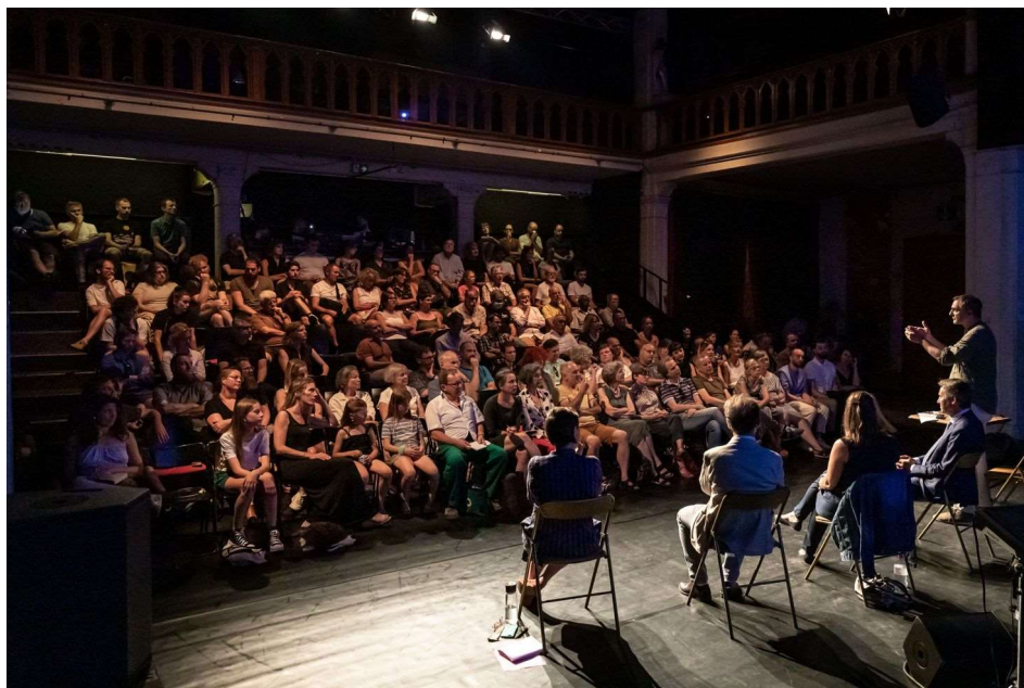
Présentation du projet La Chaux-de-Fonds Capitale culturelle suisse, Temple-Allemand, 20 juin 2022

Dès sa création, l'association a pu compter sur les forces de travail d'un chef de projet mis à disposition par la Ville de La Chaux-de-Fonds. Elle a pu, par la suite, mandater cette personne avant de salarier une adjointe pour compléter l'équipe. Au cours de l'année écoulée, l'équipe de l'association a travaillé à la définition d'un projet culturel solide pour soutenir sa candidature au titre de première capitale culturelle suisse. Elle a créé, développé et renforcé les liens avec le tissu culturel local, débuté une communication autour du projet, consolidé sa structure de gouvernance, entamé un important travail de recherche de soutiens financiers, développé ses relations avec l'association Capitale culturelle suisse et soutenu un travail de persuasion cherchant à affirmer, au niveau national, la pertinence du projet. Toutes ces actions ont pour objectif l'obtention et la reconnaissance du titre de première Capitale culturelle suisse délivré par l'association Capitale culturelle suisse.