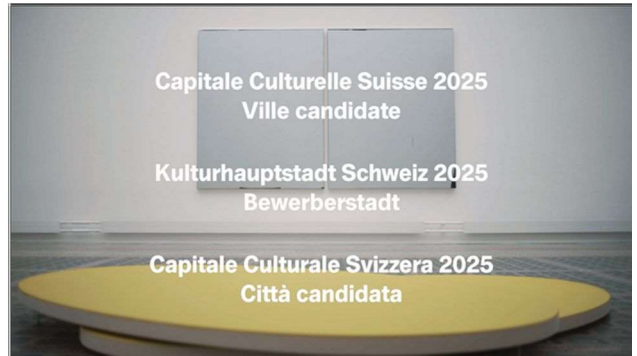
Captures d'écran du clip de promotion de La Chaux-de-Fonds Capitale culturelle suisse réalisé par Arthur Henry.